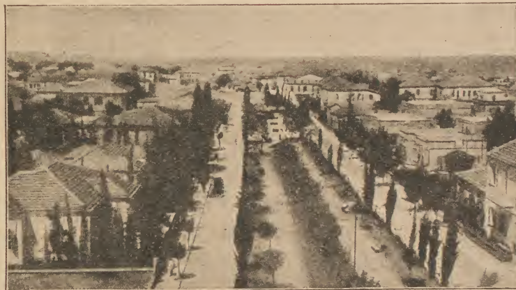
Rothschild-Boulevards in Tel Aviv

„Doch wer mir naht mit platten Füßen, mit krummer Nas' und Haaren kraus, soll deinen Strand niemals genießen, er muß hinaus, er muß hinaus!“